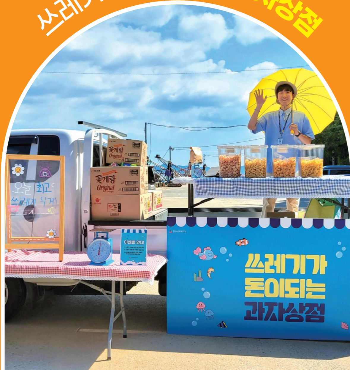
쓰레기를 줍고 처리하는 과정 자체에 즐거움을 부여하며 작은 행동으로 변화되는 캠페인