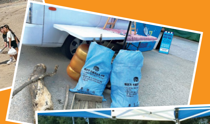
아이들의 적극적인 참여로 총 13kg에 달하는 쓰레기를 수거하였습니다.