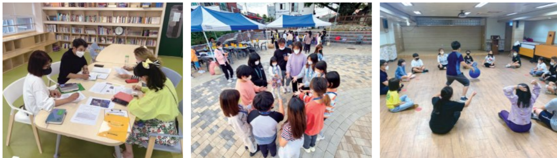
※ 보호자 서포터즈를 구성하여 보호자와 함께 진행한 놀이터

지역 내 아동 놀이단 모집 및 구성 보호자 서포터즈 구성하여 놀이 회의 및 교육 진행 지역사회 자원을 연계하여 놀이의 장 마련 놀이단과 보호자 서포터즈가 함께 놀이 프로그램 기획 및 진행