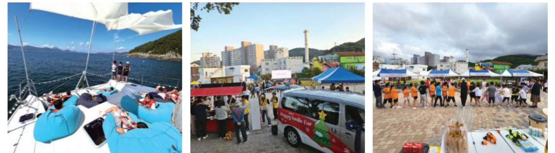
※ 지역 내 아동복지기관과 연계하여 환경을 생각하고 진행한 놀이터

환경을 생각한 놀이를 계획하는 그린놀이단 모집 지역 내 아동복지기관과 연계하여 그린서바이벌 진행 지역 내 홍보를 통해 선착순 접수하여 요트타go 비진도go 진행 지역주민 및 아동이 참여 한 도남시네마 및 팝업놀이터 진행